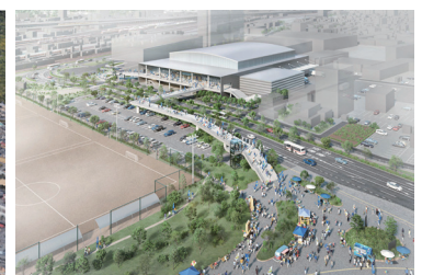
新アリーナ整備イメージ(外観)