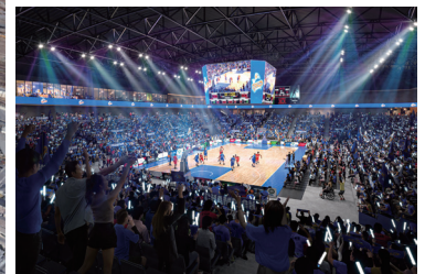
新アリーナ整備イメージ(内観) 【岡山市『多目的施設(アリーナ)整備に関する基本計画素案』より】