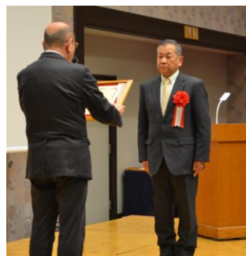
【特別賞】 岡山県フィルムコミッション協議会