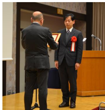
【特別賞】 倉敷高等学校 陸上競技部