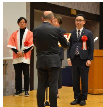
【特別賞】 愛ラブおかやま川柳