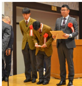
【大賞】 岡山学芸館高等学校 男子サッカー部