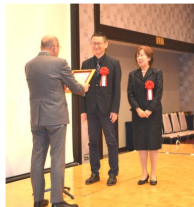
【特別賞】 特定非営利活動法人AMD A