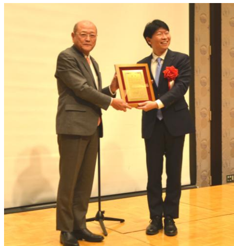
【大賞】 森の芸術祭 晴れの国・岡山